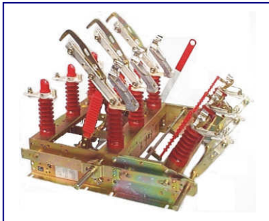
GP2V 17,5kV 630A with earthing blades