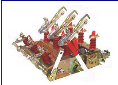
GP2V 12kV 630A with quick closing earthing blades

U r : 12 - 36 kV I r : 400 - 630 A I k : 12,5 - 25 kA/1s