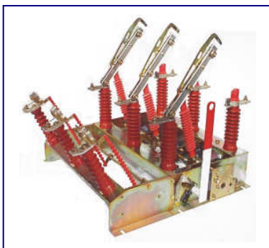
GP2V 24kV 630A